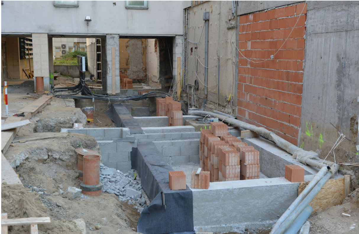
A statikai megerősítés után elkezdődhetett a falazás.

A tervrajzon látható pirossal jelölt terek külső falai látszanak az előző képen. A kék nyíl, a kép, a rajzhoz viszonyított nézőpontját mutatja.