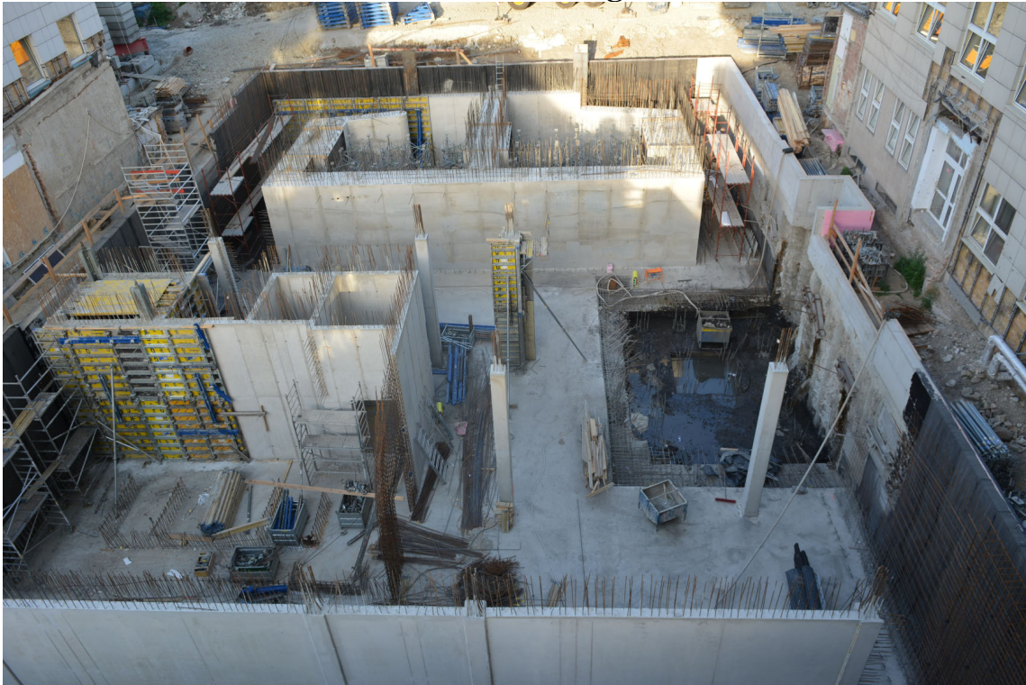
A falak elérték a talaj szintjét. Munkába állt egy kisegítő autódaru.

Sok az eső – nőnek és vastagodnak a falak